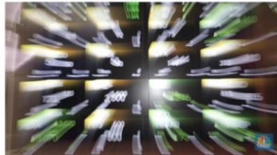
Foto: Rutra/Bursa Efek Indonesia, (CNBC Indonesia/Muhammad Sabki)

Ketiga saham tersebut adalah IPCC (PT Indonesia Kendaraan Terminal Tbk), IPCM (PT Jasa Armada Indonesia Tbk), dan TBIG (PT Tower Bersama Infrastructure Tbk). Dua saham lainnya bergerak di sektor properti (PT DMS Propertindo Tbk/ KOTA) dan sektor manufaktur (PT Surya Esa Perkasa Tbk/ ESSA).